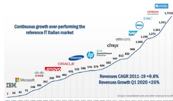
Immagine 3: evoluzione vendite Sesa (fonte. Presentazione Sesa Starconference 2019)

Nel corso dell'esercizio 2019 il Gruppo Sesa ha avviato la propria espansione sul mercato estero, grazie all'acquisizione di PBU Cad-Systeme GmbH attiva sul mercato tedesco e alla costituzione di una piattaforma di servizi digitali e PLM (Product Lifecycle Management) per aziende manifatturiere europee engineering intensive.