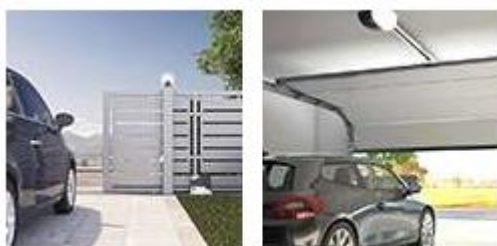
Cancelli scorrevoli Porte da garage